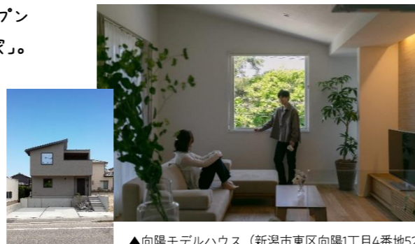
▲向陽モデルハウス（新潟市東区向陽1丁目4番地52）

目の前が公園という立地を活かした、2階リビングの緑豊かな景色。内外の一体感がありつつも、視線を気にせず過ごせるリビング。リネンのカーテンや無垢の家具など、自然素材を取り入れた心地よい空間となっています。周りに家づくりを検討されている方がいらっしゃいましたら、ぜひ一緒にフクダハウジングの家づくりをご覧ください！