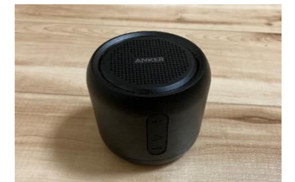
▲踊るときに愛用しているスピーカー。小さ目でスタジオにも持っていきやすい！