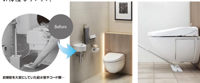
お掃除を大変にしていた給水管やコード類…

便器が宙に浮いているデザインのトイレ(フロートトイレ)は、給水ホースや電源コードが背面のキャビネットに隠れてスッキリしているので、トイレ下面のお掃除もらくらく！